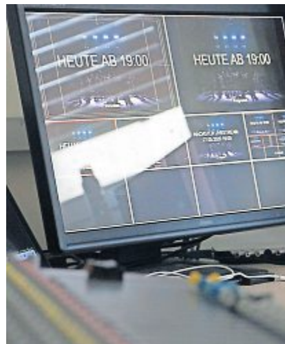
Kurz vor dem Auftritt. Punkt 19 Uhr geht es los. Ein Knopfdruck und der Stream geht online.